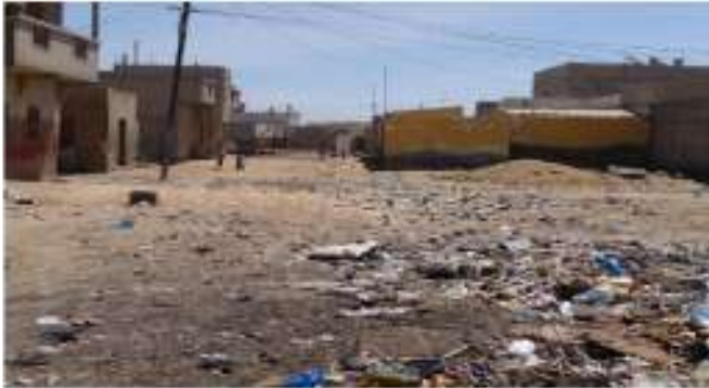
Rue du quartier du Darou, Saint-Louis

Carnet de voyage chez ADS à Saint- Louis