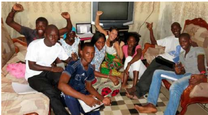
Une équipe de bénévoles motivés et enthousiastes

Ses actions sont menées et développées par les membres de l'Association et les Volontaires Bénévoles.