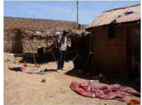
Lieu de vie des jeunes enfants talibés

ADS agit pour favoriser l'intégration sociale et professionnelle des plus vulnérables, en assistant et soutenant les enfants les plus démunis et plus spécialement les enfants talibés, les enfants de la rue ainsi que les adolescentes et filles mères défavorisées.